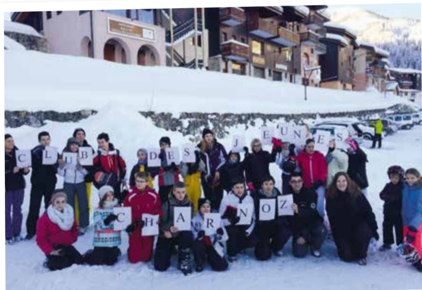
Sortie de ski organisée par le Club des Jeunes