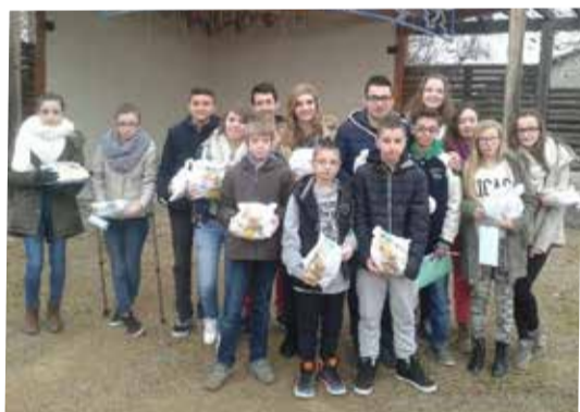
La vente de brioches du Club des Jeunes

Des travaux ont été réalisés sur ce secteur au cours du mois janvier, afin de créer de nouveaux puits perdus et de raccorder le trop plein sur le réseau communal d'eaux pluviales.