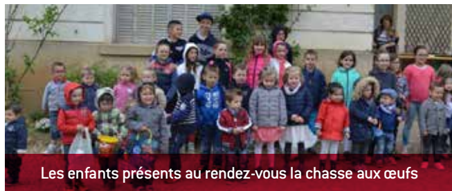
Les enfants présents au rendez-vous la chasse aux œufs

La chasse aux œufs s'est déroulée sous un temps maussade mais les enfants étaient au rendez-vous !