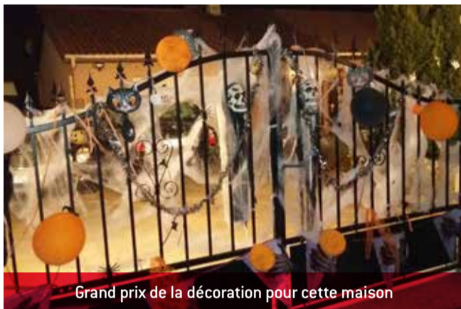
Grand prix de la décoration pour cette maison

Et pendant ce temps, dans les rues... Charnoz a frissonné de peur grâce à la participation très impliquée et effrayante de certains habitants. Merci à eux !