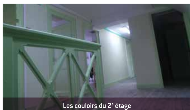
Les couloirs du 2 e étage