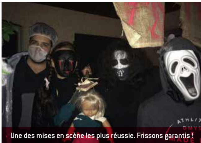
Une des mises en scène les plus réussies. Frissons garantis !