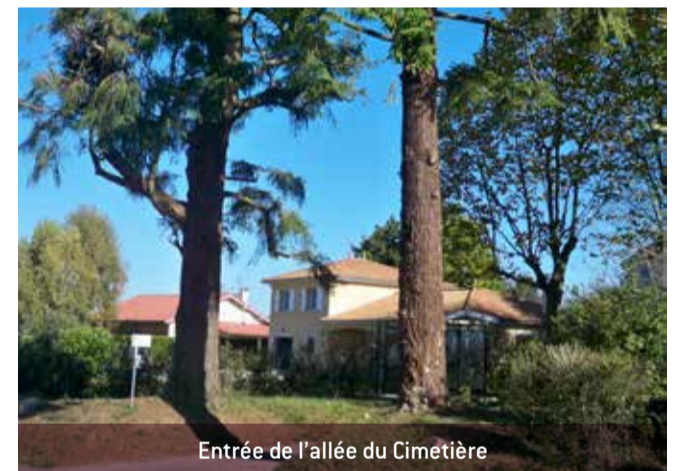
Entrée de l'allée du Cimetière

Les platanes de l'allée du Cimetière seront élagués entre le 7 et le 10 novembre : l'accès sera perturbé pendant ces quelques jours.