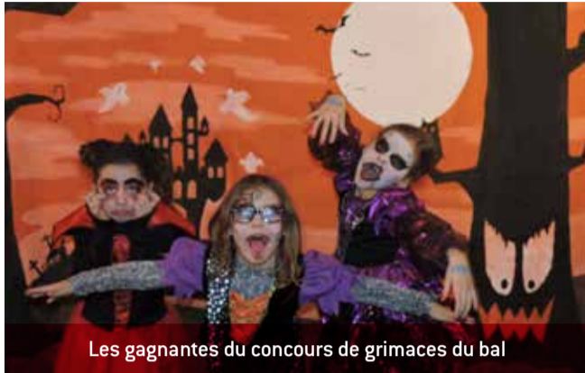
Les gagnantes du concours de grimaces du bal

Et pendant ce temps, dans les rues... Charnoz a frissonné de peur grâce à la participation très impliquée et effrayante de certains habitants. Merci à eux !