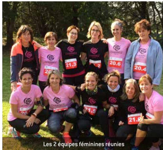
Les 2 équipes féminines réunies

Trois équipes (2 équipes féminines, 1 masculine) ont porté les couleurs de Charnoz au 2 ème Marathon Relais de la Plaine de l'Ain organisé par la CCPA le samedi 8 octobre dernier. L'équipe masculine a fini 11 e /63 au classement général (avec un relais réalisé en 3h05). Ces Charnoziens sont tous montés sur le podium de la bonne humeur et ont vécu une journée intense et forte en émotions. Bravo à tous !