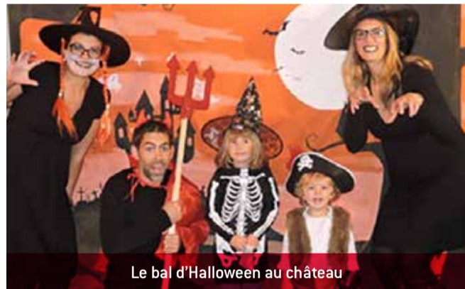
Le bal d'Halloween au château

Le Bal d'Halloween au château du Sou des écoles a réuni les adorables petits monstres charnoziens affamés de friandises ! Piste de danse avec DJ, déco soignée, concours de grimaces, buffet pour petits et grands... tout était réuni pour que ce soit une belle réussite !