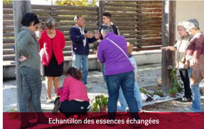
Echantillon des essences échangées

Le Troc aux plantes a réuni les curieux de botanique dans une ambiance toujours aussi conviviale. Les participants ont pu s'échanger plantes vivaces, arbustes, graines tout en savourant pâtisseries et boissons préparées par certains.