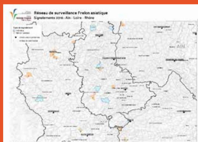
Carte 1 : carte représentative des signalements confirmés de frelon asiatique (nids et individus) sur les départements de la Loire, du Rhône et de l'Ain

En 2015 et 2016, le climat lui a été très favorable, ce qui lui a permis de coloniser de nouvelles zones géographiques et de se développer sur sa zone de présence connue.