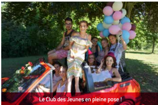
Le Club des Jeunes en pleine pose !

Le samedi 17 juin le Club des jeunes organisait un concours photo, l'après-midi au château. Malheureusement le public n'était pas au rendez-vous. Saluons cette belle initiative et la motivation de ces jeunes Charnoziens qui ont à cœur d'animer le village de façon originale. Nous ne pouvons que vous inviter à les soutenir lors de leurs prochaines animations !