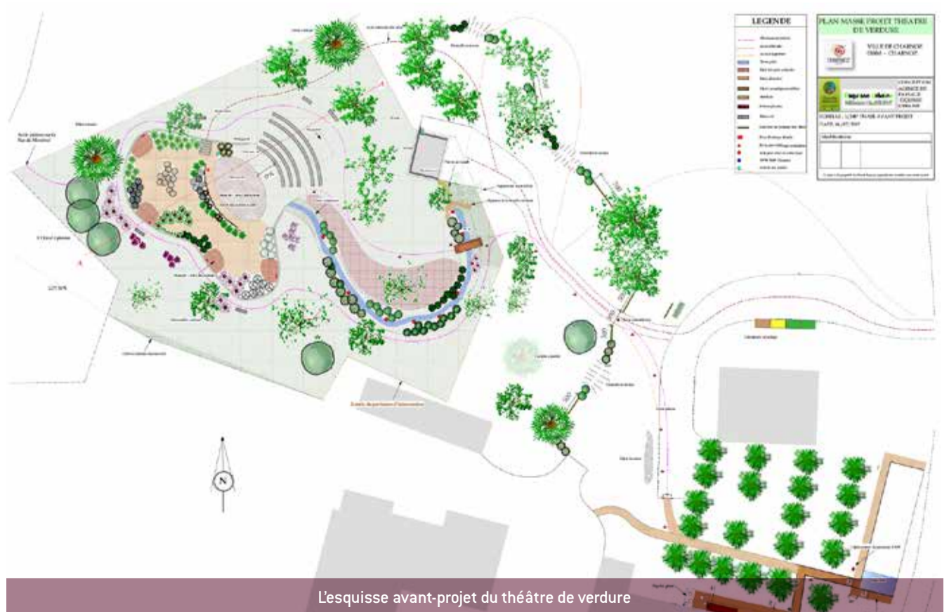
L'esquisse avant-projet du théâtre de verdure

La commission a réuni les associations charnoziennes pour l'organisation du prochain forum des associations qui aura lieu le 9 septembre 2017 de 15h à 18h.