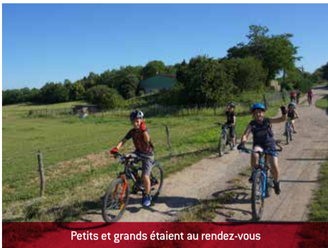
Petits et grands étaient au rendez-vous

Le dimanche 11 juin, la traditionnelle course VTT du Sou des écoles a rencontré un vif succès cette année avec 286 participants ! Les cyclistes de tous âges ont pu découvrir les différents parcours, réalisés par Robert Dumas, lors de cette belle journée ensoleillée.