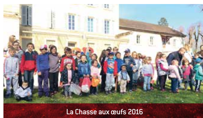
La Chasse aux œufs 2016