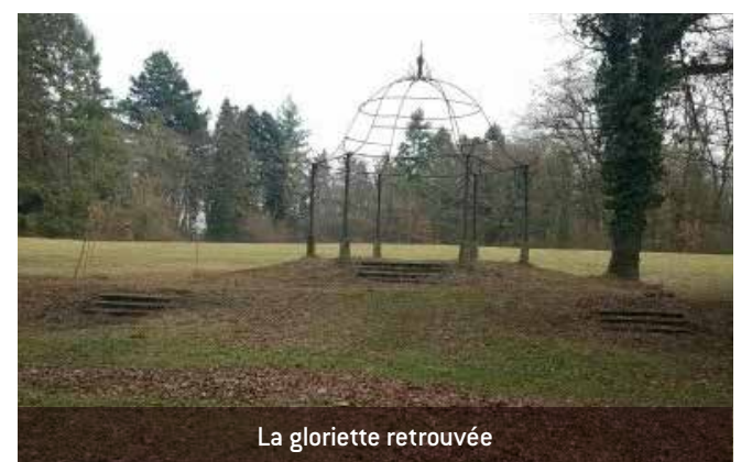
La gloriette retrouvée

Grâce aux agents techniques, la gloriette a retrouvé sa silhouette d'antan dont la structure et les abords étaient envahis par les ronces.