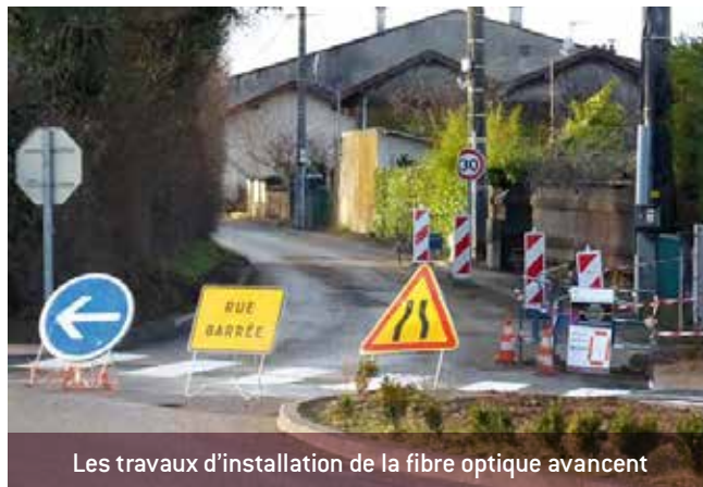
Les travaux d'installation de la fibre optique avancent