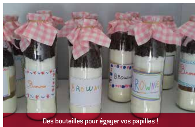
Des bouteilles pour égayer vos papilles !

Pensez à la fête des grands-mères le 5 mars... Le sou des écoles innove avec cette vente de bouteilles à Brownies, réalisées par les élèves de l'école de Charnoz de la maternelle au CM2. Ces préparations originales sont vendues 5 euros pièce. Il n'y a pas de date limite de commande, il suffit de contacter la Présidente, Mme Grivet au 06 22 42 03 50 . Attention nombre de bouteilles limitées !