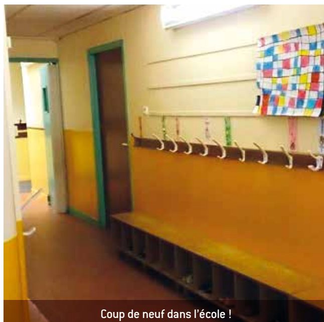
Coup de neuf dans l'école !

Durant les vacances solaires, les peintures du couloir côté maternelle ont été refaites.