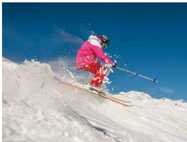
A vos skis, surf, snowboard...

Le Club des Jeunes organise une sortie de ski le samedi 28 janvier 2017 à Valmorel. Pensez à réserver ! (Nombre de place limité). Rendez-vous à 6h30 au château pour un départ à 6h45 et retour prévu vers 19h30 au château.