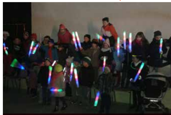
Les enfants réunis avant le départ du défilé

Le défilé aux lampions, organisé par le Sou des écoles a illuminé les rues du Loyat.