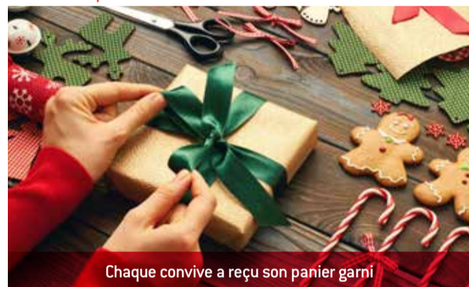
Chaque convive a reçu son panier garni