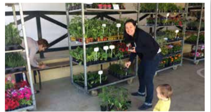
La vente de fleurs du Chaudron Magique