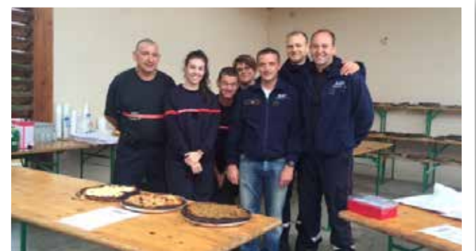
La vente de tartes